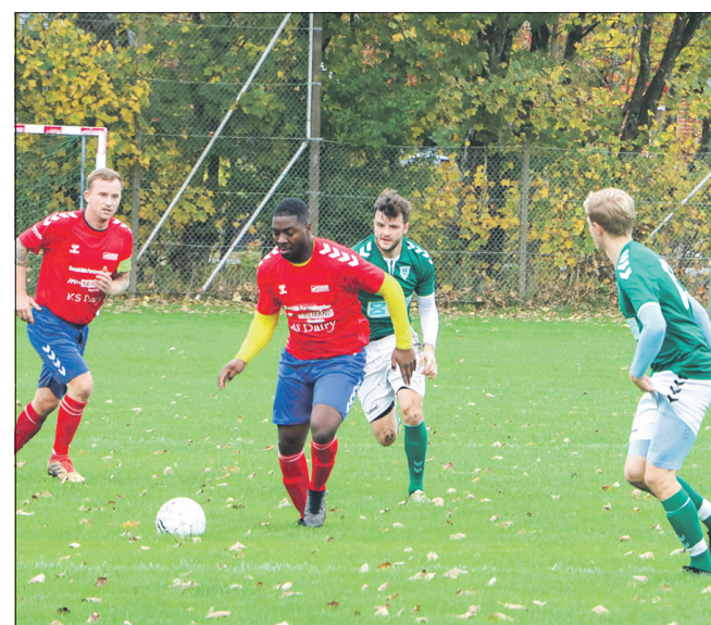
Nibes spillere blev ind imellem udfordret.

Send fotos og tekst til: avis@norageravis.dk