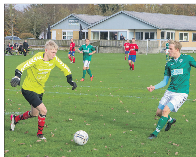
Ravnkildes målmand havde en travl dag.