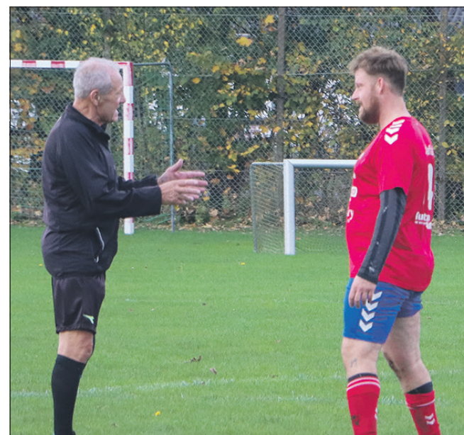
Ravnkildes anfører modtager irrettesættelse af kampens dommer.