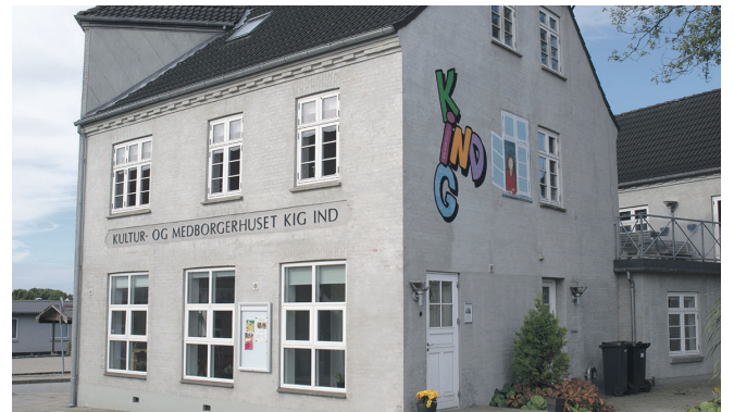
Kig ind i Nørager.