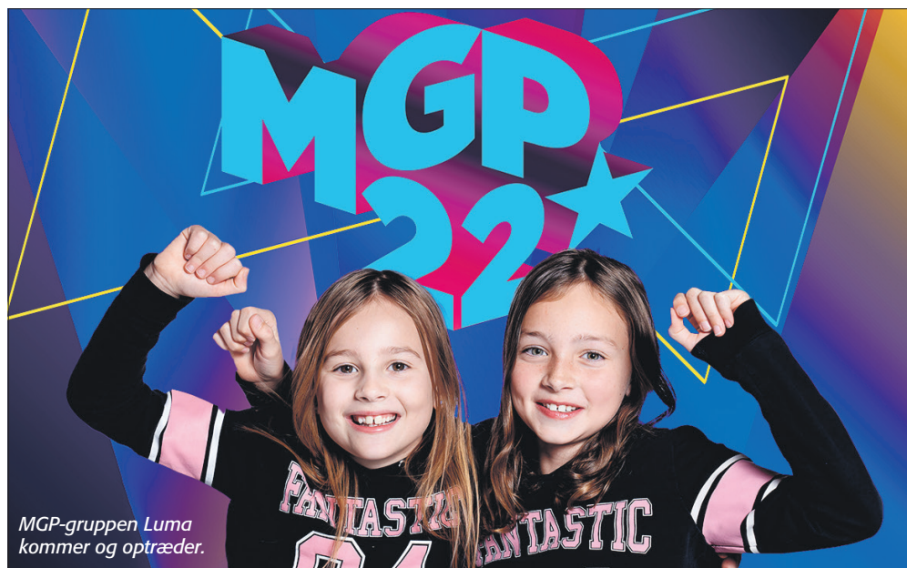
MGP-gruppen Luma kommer og optræder.

Kom og vær med, når Frivilligcenter Rebild for første gang afholder Frivillig Festival. Frivillig Festival er et nyt initiativ, som understøtter og synliggør foreningslivet her i Rebild Kommune. 2022 bliver dermed året, hvor starten på et nyt og spændende arrangement vil vende tilbage år efter år i Rebild Kommune.