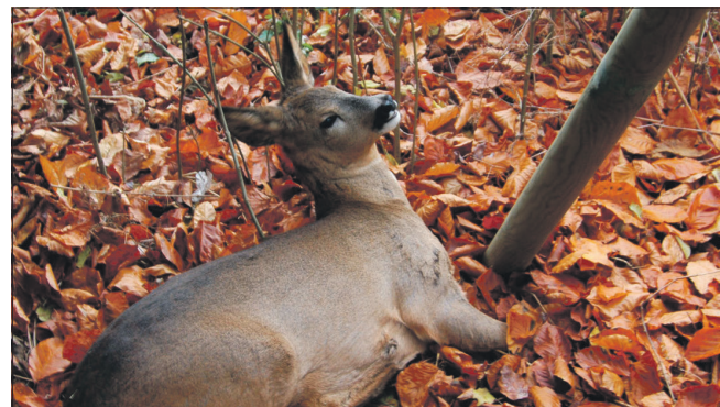
Højsæson for påkørte hjorte starter nu. Opfordringen lyder derfor: sænk farten og vær opmærksom når du kører bil.

Højsæson for påkørte hjorte starter nu, og Dyrenes Beskyttelses Vagtcentral 1812 forventer omkring 4000 henvendelser de næste tre måneder. Opfordringen lyder derfor: Sænk farten og vær opmærksom, når du kører bil